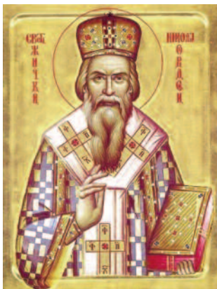
San Nicola Velimirovic

Бальзам сей больных делает здоровыми, а здоровых — ещё более здоровыми. Бальзам сей мёртвых животворит, а в живых умножает жизнь. Бальзам сей умудряет, облагораживает, обоживает человека, стократно и тысячекратно увеличивает его силы и возносит его достоинство высоко над всею сотворённою природою, даже до возвышенности и велелепия Божиих Ангелов и Архангелов.