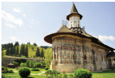
Monastero Sucevita, Romania

senti. Per la tradizione della Chiesa, codificata dai Concili, l'icona è un "sacramentale partecipe della sostanza divina", è il luogo in cui Dio è presente e può essere incontrato, una grazia della sua infinita misericordia, un'occasione "per toccare un lembo del suo mantello". Tramandando per secoli questa arte delle arti che è l'icona, i popoli ortodossi l'hanno fatto con la convinzione che essa esprime gli ineffabili splendori della bellezza divina. Citando Dostoevskij, Pavel Evdokimov, nel suo libro "Teologia della bellezza", dice che "la bellezza salverà il mondo". L'icona sembra possa rappresentare al meglio un popolo che nella contemplazione della bellezza e nella preghiera ritrova la sua anima. Tesoro della Chiesa indivisa, l'icona può essere anche un luogo ecumenico privilegiato. Non a caso i padri della Chiesa chiamarono le icone "finestre del cielo". La loro presenza, oggi, in tutto il mondo cristiano conferma la loro vocazione di simbolo che può essere il ponte verso l'unità di tutti i cristiani. Se vogliamo affrettare l'unione tra la Chiesa d'Oriente e d'Occidente dobbiamo conoscerle, apprezzarle, capire quale tesoro spirituale esse rappresentano per tutti i cristiani.