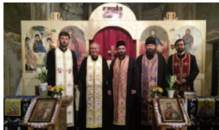
Vespere ortodosse a Bellinzona

dunque al sinodo circa 300 vescovi dei 900 che contano tutte le Chiese Ortodosse. Il sinodo non si propone di discutere i problemi dogmatici, ma quelli canonici, liturgici e sociali.