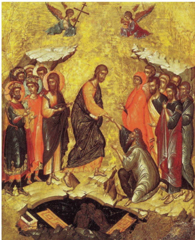
La Resurrezione di Cristo - Icona greca