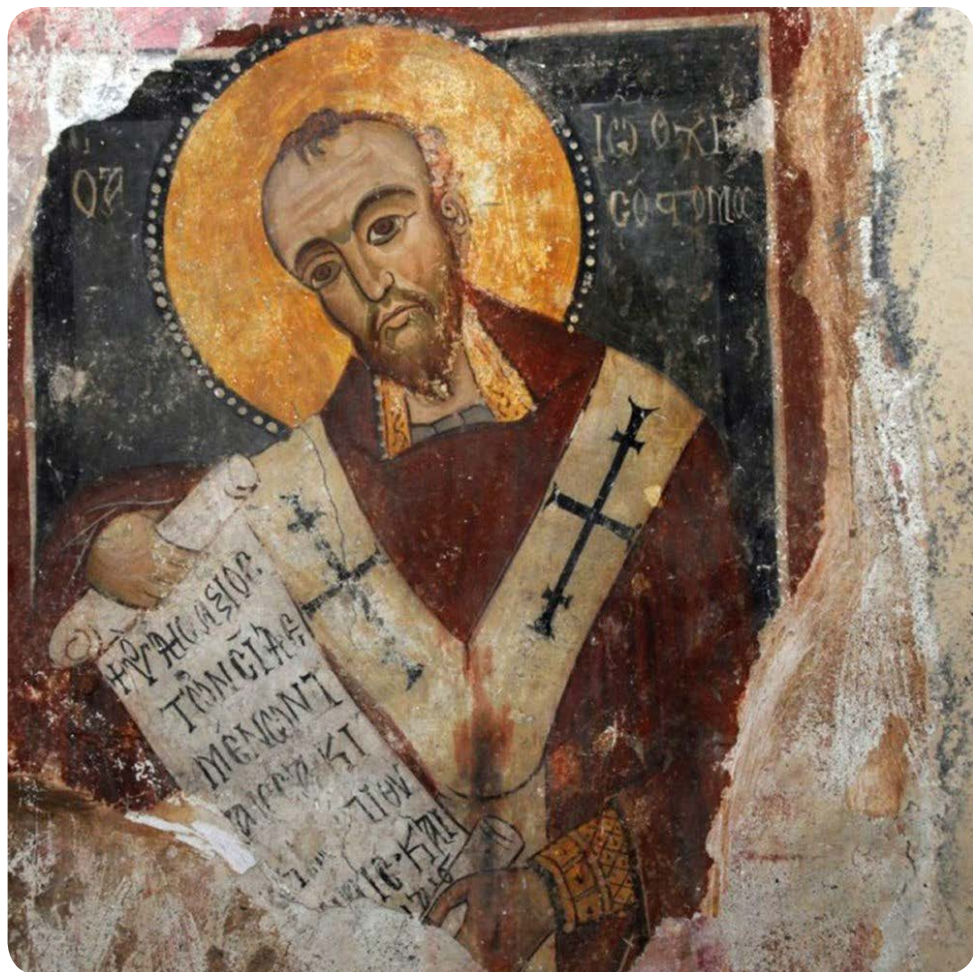
San Giovanni Crisostomo in un affresco del XV secolo. Chiesa della Panaghia, Rossano Calabro.

Padre dei secoli futuri viene tenuto tra le braccia di una vergine madre come bambino lattante [...].