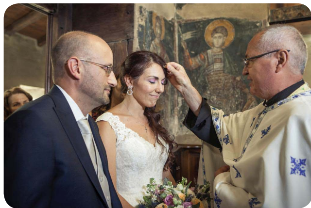
Matrimonio di Fabrizio e Chrisy, Thessaloniki

che la stragrande maggioranza degli ucraini, liberi di decidere, si trova in comunione con questo Patriarcato, e ricordando che nel 1997 lo stesso patriarca Bartolomeo I, con una lettera indirizzata all'allora patriarca di Mosca Alessio II aveva scomunicato Filarete (fondatore della Chiesa Ortodossa ucraina autoproclamatasi indipendente) e "anatemizzato"