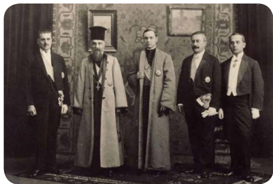
La delegazione della Transilvania che consegnò la "Dichiarazione di unione" al re Ferdinand nel 1918 (Vasile Goldiș, Miron Cristea, Iuliu Hossu, Alexandru Vaida-Voievod și Caius Brediceanu).

nostra storia che secondo gli storici romeni è stata scritta dall'intera nazione romena.